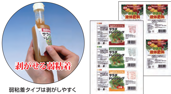
弱粘着タイプは剥がしやすく 糊残りがありません。