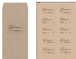
Photo: CCL-43 宛名ラベル使用例